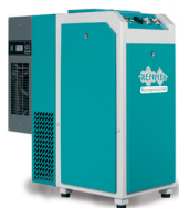
RSK-TOP 3,0 - 7,5 kW

RENNER Schraubenkompressoren mit Kältetrockner