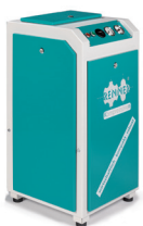
RS-TOP 3,0 - 7,5 kW

Mobil 0172 2103 735 eMail: info@druckluft-thatenhorst.de Internet: www.druckluft-thatenhorst.de