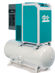
RSDK-TOP 3,0 - 7,5 kW

RENNER Schraubenkompressoren mit Druckluftbehälter