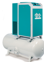
RSD-TOP 3,0 - 7,5 kW

RENNER Schraubenkompressoren mit Kältetrockner